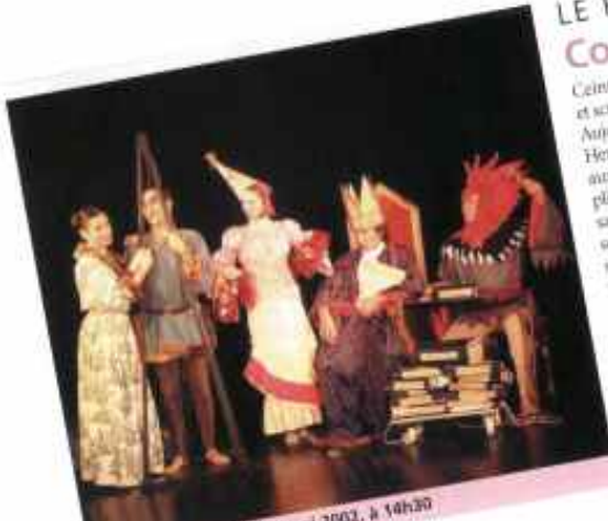
Parc Floral (Paris). Le 22 mai 2002, à 14h30